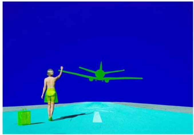
Runway ( Photographie / Photography)

Parallèlement à cette nouvelle œuvre, «Queen of Paradis» ,un long métrage documentaire sur l'artiste a été réalisé et filmé par Carl Lindstrom qui l'a suivi dans un voyage surréaliste à travers les États-Unis alors qu'elle travaillait pour compléter sa série «Midnight». Une projection exceptionnelle de ce long métrage aura lieu au Silencio le 15 et 16 novembre 2018. Reine Paradis est basée à Los Angeles , son travail est exposé depuis quelques années aux quatre coins des États Unis et a ainsi rejoint plusieurs collections privées .