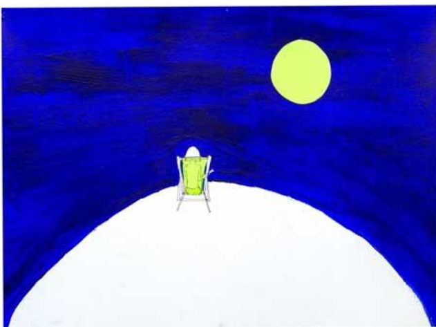
The Cliff ( Maquette / sketch)