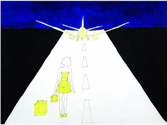
Runway ( Maquette / sketch)