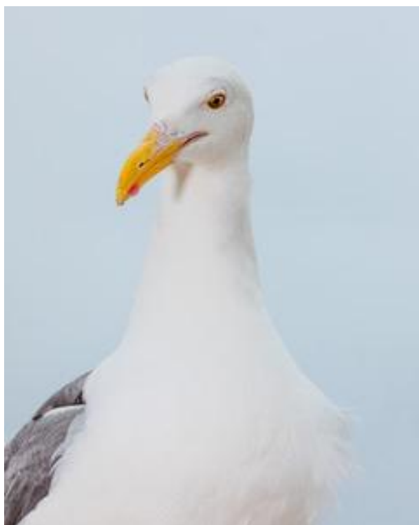
Seagull #4611© Will Adler

Connu pour ses photos sur le monde du surf, ses images à la lumière diffuse traduisent l'esprit et l'atmosphère du lieu autant que l'action du sport et lui ont values un véritable culte dans le cercle de la photographie de surf .