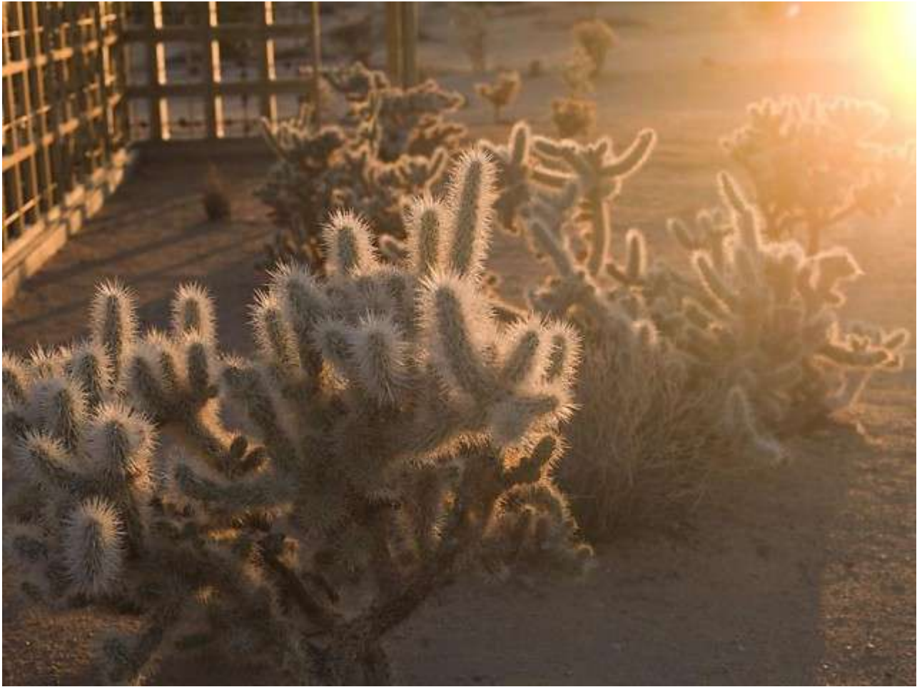
AD 6705, 2014, from the Acido Dorado series, chromogenic print