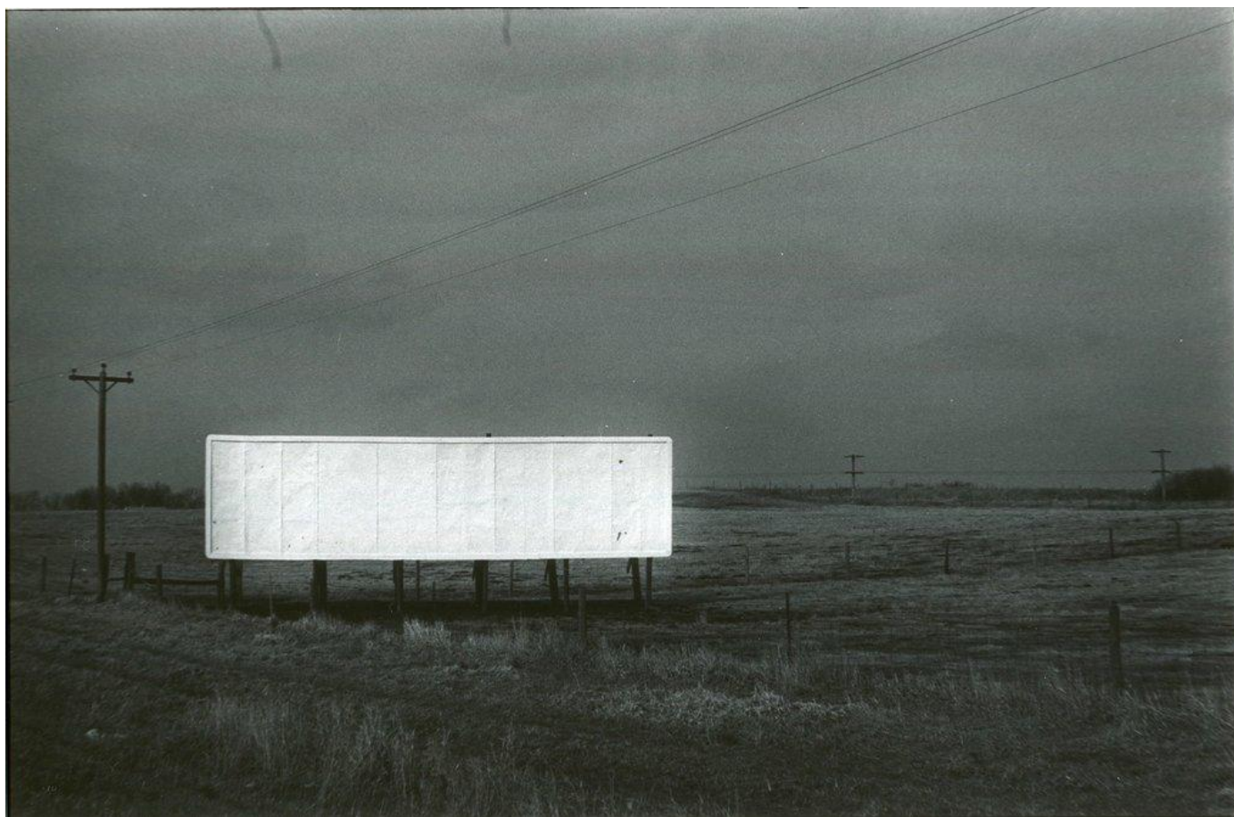
Billboard, USA, 1976

Deux expositions muséales seront consacrées en 2019 à son travail: à Bâle de Février à Juillet 2019 dans une exposition collective, intitulée "Israël, from Dreams to Reality" et en Novembre 2019 son Portfolio sur l'Irlande sera exposé à la National Gallery of Ireland à Dublin.